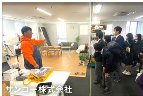
サンコー株式会社