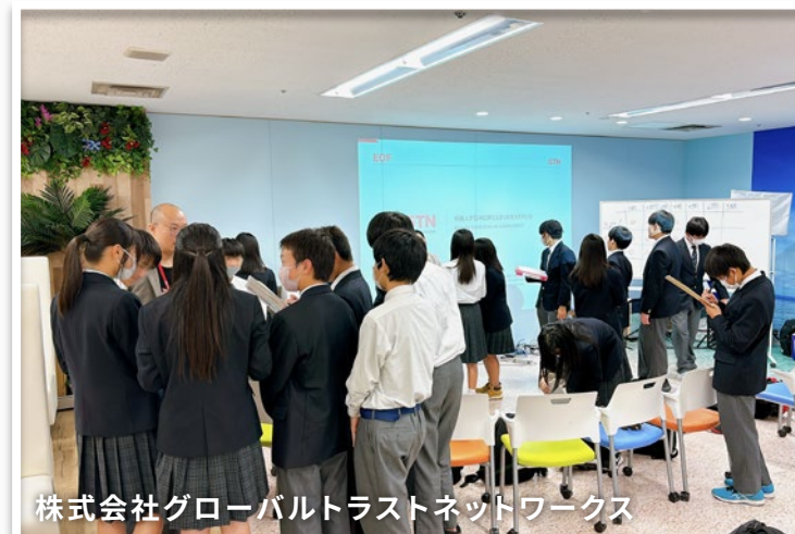
株式会社グローバルラストネットワークス