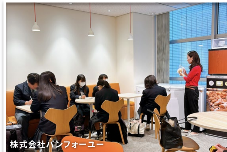
株式会社パンフォーユー