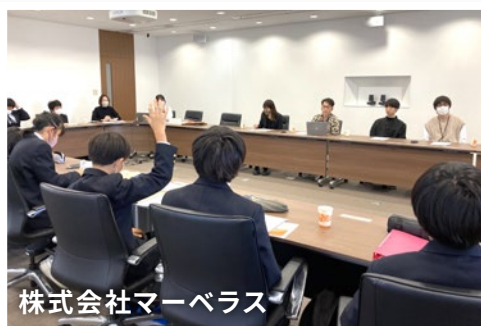
株式会社マーベラス